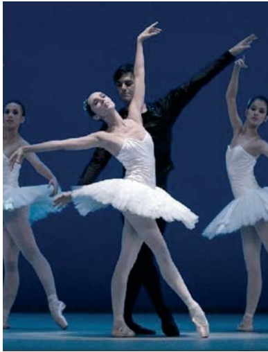
Cuerpo del ballet del Teatro Colón.

El romanticismo fue una corriente que influenció el arte del siglo XIX. En cuanto a la danza, el período romántico se extiende durante la primera mitad del siglo XIX.