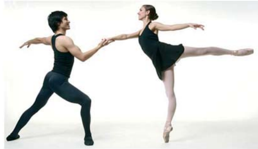
Pas de deux (paso de dos).