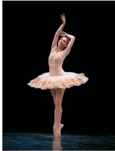
Bailarina con tutú.

En San Petersburgo encontramos la figura del 'compositor de ballet de los Teatro Imperiales', cargo que asumieron Cesare Pugni, Leon Minkus y Riccardo Drigo, por ejemplo. Pero sin lugar a dudas las mejores partituras de ballet vinieron de la mano de Piotr Ilich Tchaikovsky, autor de El lago de los cisnes , La bella durmiente del bosque y El cascanueces .