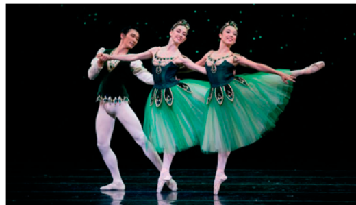
Pas de trois (paso de tres).