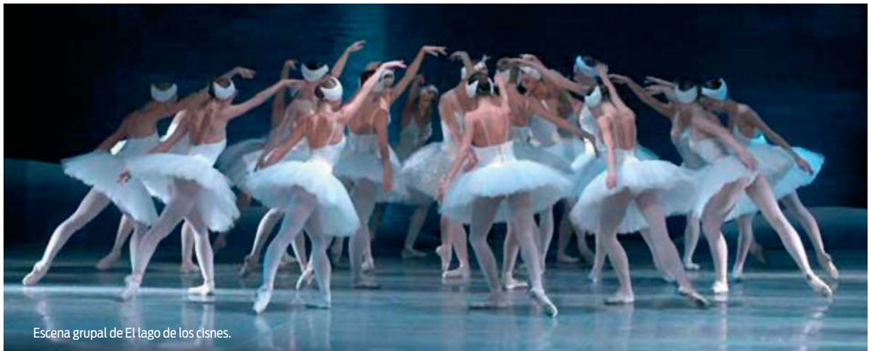
Escena grupal de El lago de los cisnes.