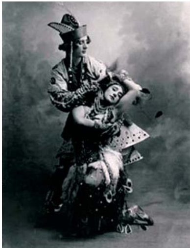
Nijinski y Karsavina.

A principios del siglo XX, el modelo de ballet creado por Petipa decaía. El público renegaba de los ballets extensos, demasiado virtuosos, demasiado alejados de la realidad, meros muestrarios de habilidades técnicas. Una nueva estética se abría paso lentamente de la mano del ruso Mijail Fokin y sus nuevos principios: historias breves, equiparación de la coreografía, la música, la escenografía y el vestuario; no a la técnica por la técnica misma; la danza debe tener alguna justificación dramática o estética.