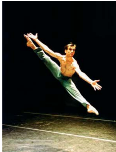
Bailarín de danza moderna.

Dentro de las figuras más relevantes de la danza mundial del siglo XX, podemos mencionar a Rudolf Nureyev, Margot Fonteyn, Mijail Baryshnikov, Alicia Alonso, Maia Plisetskaya, Carla Fracci, Alessandra Ferri, y dentro de los argentinos Julio Bocca, Maximiliano Guerra, Paloma Herrera, Marianela Nuñez, entre otros.