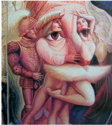
Don Quijote: Octavio Ocampo - México 1943.